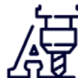
Découpe | Usinage | Gravure